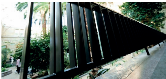
HUDEVAD radiator type SC (her anvendt som balustre i Vinterhaven på Glyptoteket i København) - én ud af mange typer HUDEVAD og RIOpanel radiatorer, der i dag sælges i Tyskland, England, Norge, Sverige, Frankrig, Holland - og Danmark!

at forholdet mellem mange kunder og deres banker er blevet meget tyndslidt op gennem krisen. "Det er jo meget naturligt. Men den dag, det igen bliver muligt at skifte bank, da bliver der fandme travlt på landevejen," siger han.