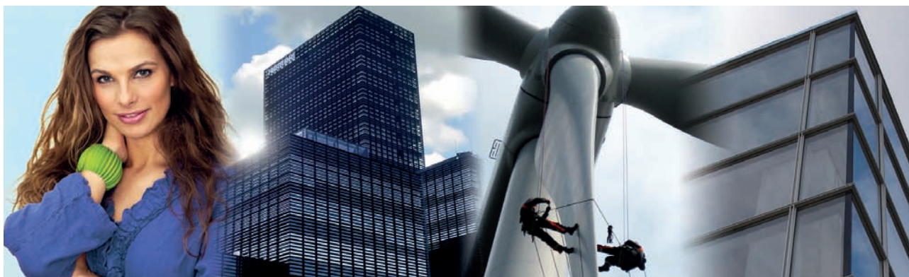
Nogle af de nyeste virksomheder, som Industri Udvikling har investeret i tæller bl.a. Uno Danmark A/S, Brødrene A. & B. Andersen Entreprenører og Ingeniører A/S, Total Wind Group A/S og ConFac A/S.

Af de 338 mio.kr. i den nyeste fond er der endnu ikke brugt en tredjedel. Så der er stadig plads til investeringer i typisk modne virksomheder, som helst skal have mindst 50 mio.kr. i omsætning, men på den anden siden heller ikke skal være for store.